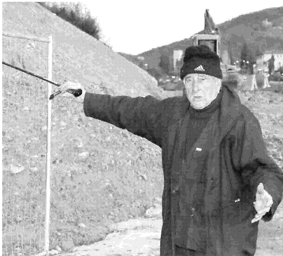
ALLARME Scatta subito la protesta degli abitanti che vivono a ridosso del cantiere autostradale per la realizzazione della terza corsia dopo Firenze sud