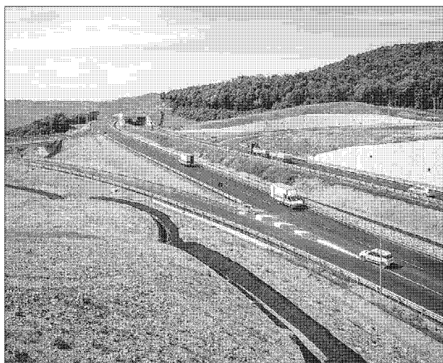
Siena-Grosseto I lavori del lotto numero 9 dovrebbe essera appaltati entro il 2018

chiudere la conferenza di servizi e inviare il progetto al Cipe. Con l'approvazione del Cipe si potrà eseguire la progettazione esecutiva e quindi, sempre secondo Anas, avviare le procedure di affidamento entro il 2018. Tradotto: serviranno ancora diversi anni. Nell'occasione Anas ha fatto il punto sugli altri lotti. Per il 4, che riguarda un tratto di 2,8 km e congiunge il maxi lotto con il tratto già ammodernato a Civitella Marittima, il progetto definitivo è stato approvato dal Cipe ed è in corso la progettazione esecutiva. Procedure di affidamento dei lavori entro marzo 2018. Nel progetto 5 nuovi viadotti e una galleria oltre all'adeguamento di alcune opere esistenti. Investimento di 106 milioni. Infine il "maxi lotto": è già fruibile a 4 corsie per la quasi totalità del tratto di 12 km, compreso il nuovo viadotto "Farma". I lavori attualmente riguardano il completamento della galleria di Pari e la realizzazione della sovrastruttura stradale, della segnaletica e degli impianti di illuminazione, antincendio, Sos, videosorveglianza e segnaletica. Apertura della galleria entro il primo trimestre 2018. E' vero, passi avanti. Ma il giorno in cui la Mare sarà completata, sarà sempre e comunque troppo tardi: Siena e Grosseto aspettano da decenni.