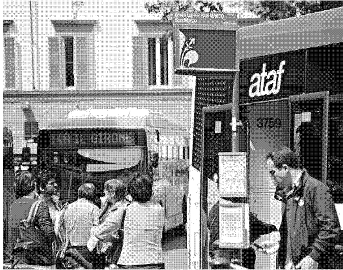
Rivoluzione all'Ataf, con le nuove tramvie cambiano le linee e i collegamenti