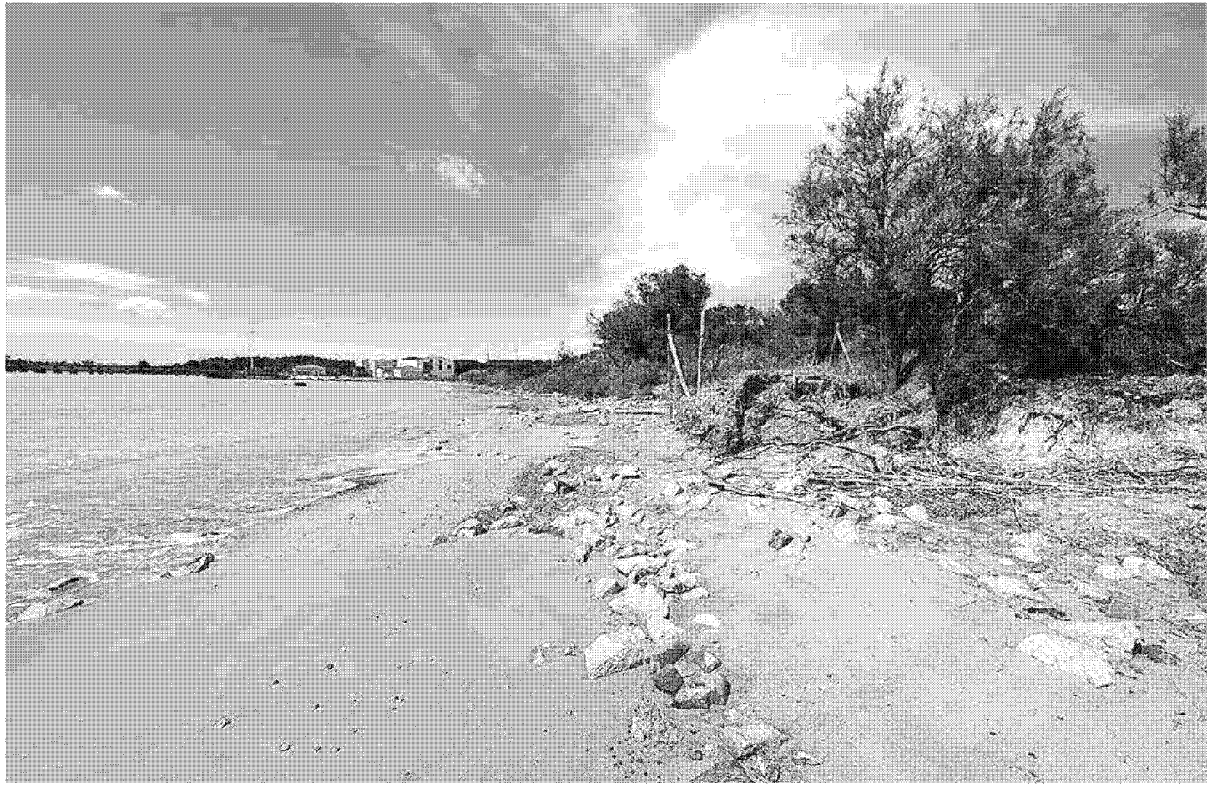
La spiaggia della Bucaccia erosa dalle mareggiate