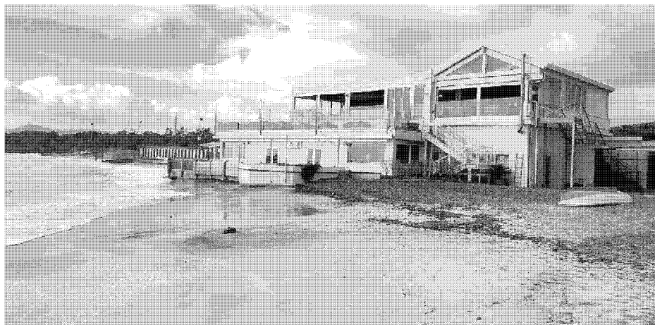
Una veduta dell'arenile eroso davanti alla Barcaccia