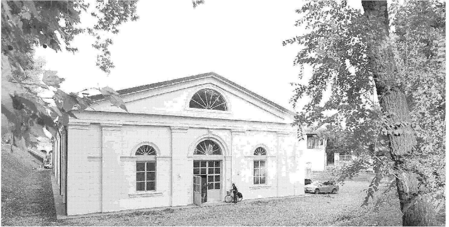
L'ex Cavallerizza