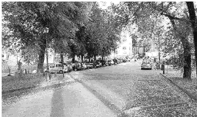
Sulla scesa di San Paolino sarà vietata la sosta

Dopo il via libera della giunta, nei prossimi giorni sarà indetta la gara pubblica per partire con i lavori, che avranno una durata di circa tre mesi.