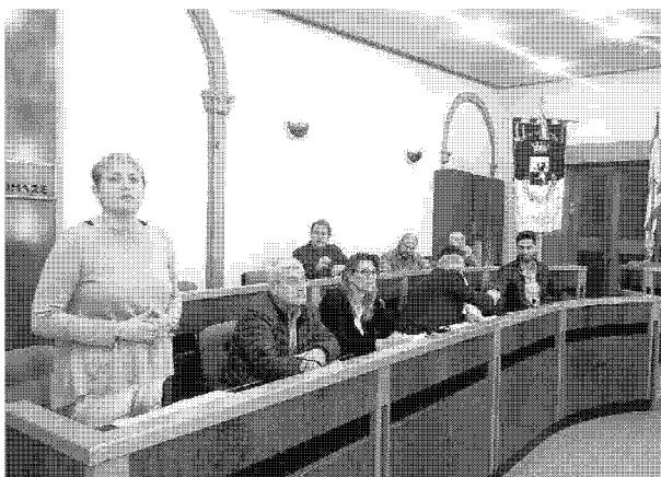
La presentazione ieri a Fucecchio del progetto che è stato finanziato