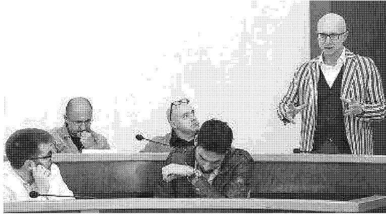
L'incontro in Comune sul progetto 'Acque e biodiversità'