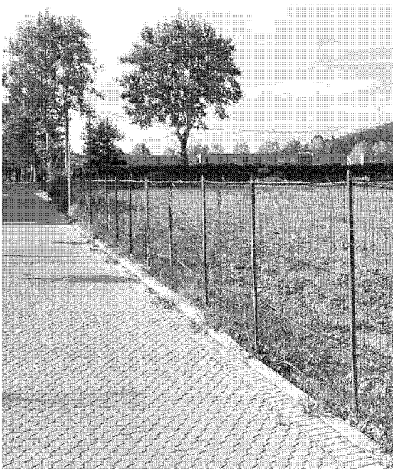
La zona in cui sorgerà il nuovo quartiere