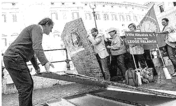
La protesta dei Verdi davanti alla Camera contro il ddl Falanga

Il senatore di Ala avverte: il nostro sì alla riforma elettorale è subordinato all'approvazione del mio disegno di legge