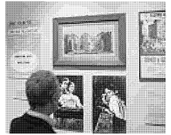
La sezione dedicata a Giulietta e Romeo