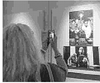
Una delle sale dedicate al cinema