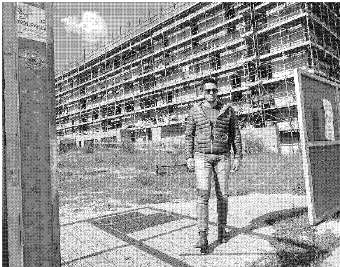
Riprendono i lavori alle Piagge: nei quattromila metri quadrati del Casone nasceranno 83 appartamenti