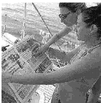
Due volontarie leggono Il Tirreno

I volontari hanno perlustrato il mare e tutte le calette Pochi ingombranti trovati, grazie al buon lavoro dei custodi