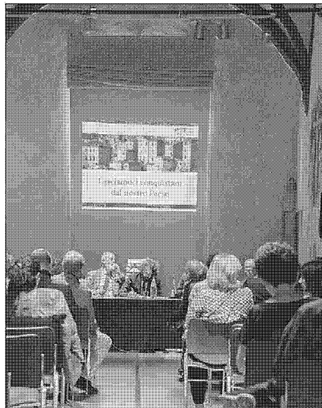
World Tourism Event ieri l'apertura dei lavori che andranno avanti anche oggi e domani