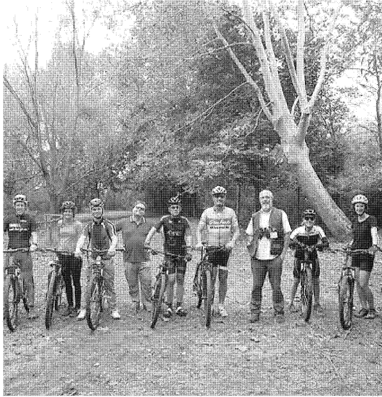
Alcuni tour operator e giornalisti del settore nel Padule di Fucecchio nella Riserva naturale «Righetti»