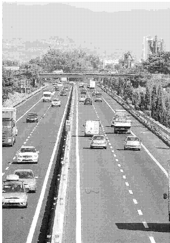
Un tratto dell'autostrada Firenze - mare in provincia di Pistoia (Gori)