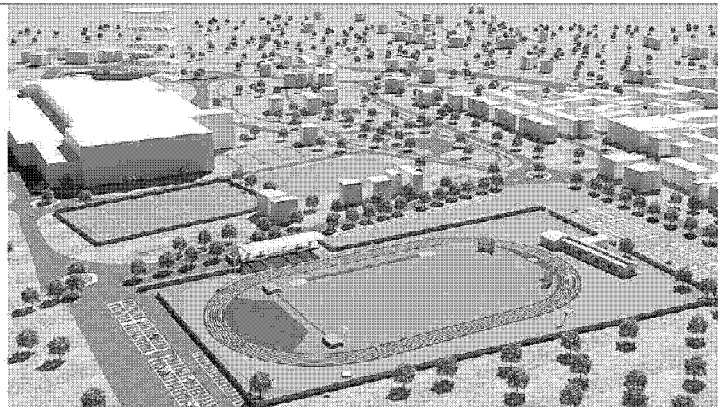
Ecco come sarà l'impianto di atletica che sorgerà dietro alla Coop di Santa Maria