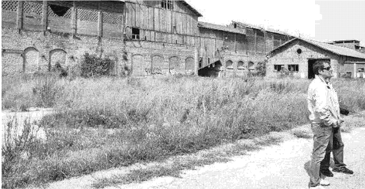
RUDERE Ecco come si presenta la fabbrica ex Sitoco alle porte di Orbetello: è un sito che va bonificato