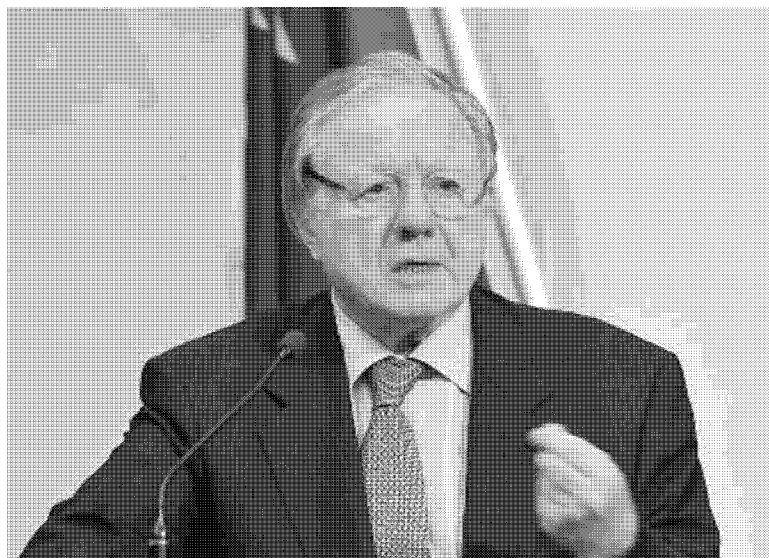
LA BATTAGLIA Il senatore di Forza Italia Altero Matteoli

«Evidentemente Castellucci, che è proprietario anche della A1, ha paura che facendo questa autostrada si dividano i traffici, ma sbaglia. Io faccio questa strada tante volte per andare a Cecina e il fine