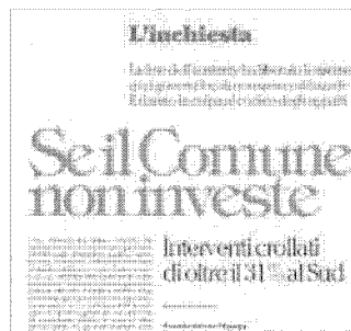
I COMUNI FERMI Lunedì su Repubblica l'inchiesta sul calo degli investimenti dei Comuni