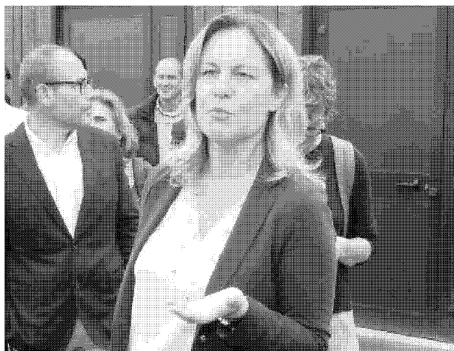
L'assessore regionale all'ambiente e termalismo Federica Fratoni

«Ci sono l'intenzione e l'attenzione di valorizzare una risorsa che la Regione ha certo a cuore»