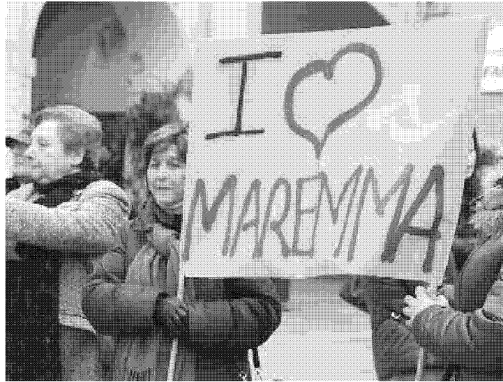
FRONTE DEL NO Una delle manifestazioni contro l'autostrada

TIRRENICA , nuova bagarre. Alle dichiarazioni del vice ministro Riccardo Nencini (Psi), storico sostenitore della formula autostradale che ha annunciato un nuovo incontro per decidere il futuro dell'infrastruttura, ecco che seguono i richiami di Legambiente e Sì, altrettanto storici sostenitori dell'adeguamento dell'Aurelia. E mentre è ancora tutto fermo, nell'attesa che il governo sciolga il rebus sul futuro di questo tratto stradale, gli uffici dei Comuni interessati dal tratto tra Grosseto e Ansedonia sono ancora al lavoro per consegnare entro la fine di agosto le osservazioni su un tratto che, secondo quanto stabilito dal Governo, dovrà essere rivisto. Questo perché, nonostante l'inserimento della Tirrenica nelle opere da rivedere, la Regione prosegue il proprio iter non avendo ricevuto comunicazioni dirette in merito. Di tutti gli intrecci che si sono avvicendati nella tortuosa storia della Tirrenica, questo è forse quello più ingarbugliato. Tra i punti fermi, c'è l'opinione di Legambiente. «In merito alle recenti dichiarazioni del viceministro Nencini - ha spiegato Angelo Gentili, della segreteria nazionale di Legambiente - che continua a