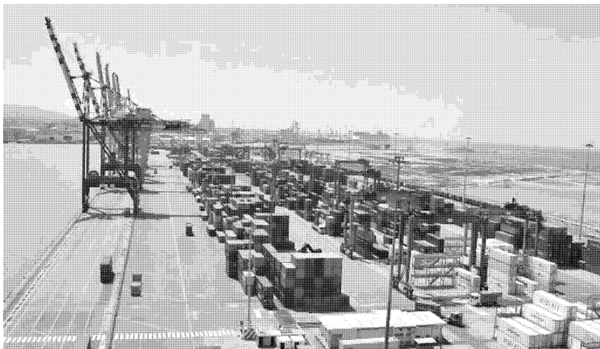
INTERVENTO La nascita della piattaforma Europa libererà le due sponde della Darsena Toscana dai contenitori