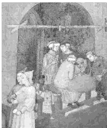
BUONGOVERNO Un particolare dell'affresco

Le opere saranno soprattutto al Santa Maria e a Palazzo pubblico