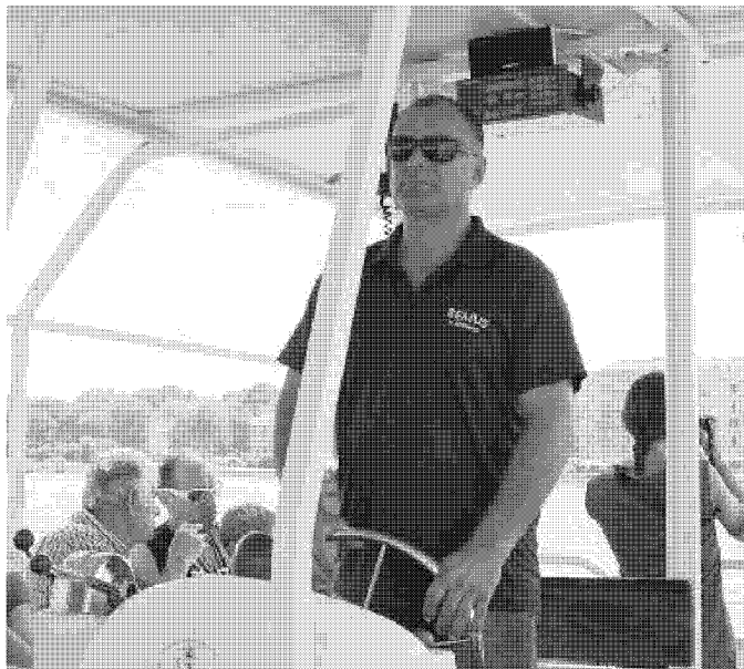
ANCHE IN ACQUA Nuovi battelli dalla laguna verso le spiagge e anche dalle coste dell'Argentario fino all'Isola del Giglio

«Il progetto si propone di rendere protagonisti i cittadini e gli operatori locali – spiegano i responsabili – che, conoscendo pregi e peculiarità del territorio, sono chiamati, già in questa prima fase ideativa, a intervenire con suggerimenti e osservazioni per una migliore riuscita dei servizi proposti. Life for Silver Coast , grazie consigli e alle proposte di tecnici e utenti, sarà pienamente operativo nell'estate del 2019. Il sistema prevede una fase di sperimentazione di circa due anni, al termine della quale il servizio entrerà a completo regime e sarà parte integrante del sistema di trasporto pubblico locale». Il progetto avrà un forte impatto (positivo) ambientale: grazie al nuovo sistema di mobilità, si prevede una riduzione di circa 1.200 tonnellate di Co2.