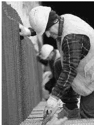
I cantieri della tramvia

I RIMEDI I lavori non si sono fermati ma al momento si procede con uno scavo assistito