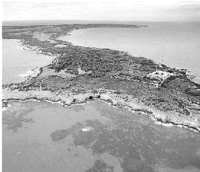
Una veduta aerea di Pianosa