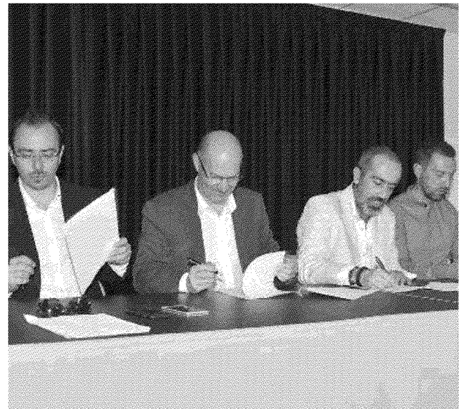
SIGLATO Un momento della firma del Protocollo d'intesa sul Parco di Montioni tra gli amministratori coinvolti

PRESTO ci sarà la prima riunione operativa del tavolo sul Parco di Montioni. I sindaci e gli assessori che hanno firmato il Protocollo d'intesa hanno parlato di promozione del territorio e di destagionalizzazione: l'obiettivo è avvicinarsi a nuove fasce di turismo, come a quello legato alla due ruote o ai cavalli. E il Parco di Montioni, in questo senso, è una riserva che può aprire nuove frontiere.