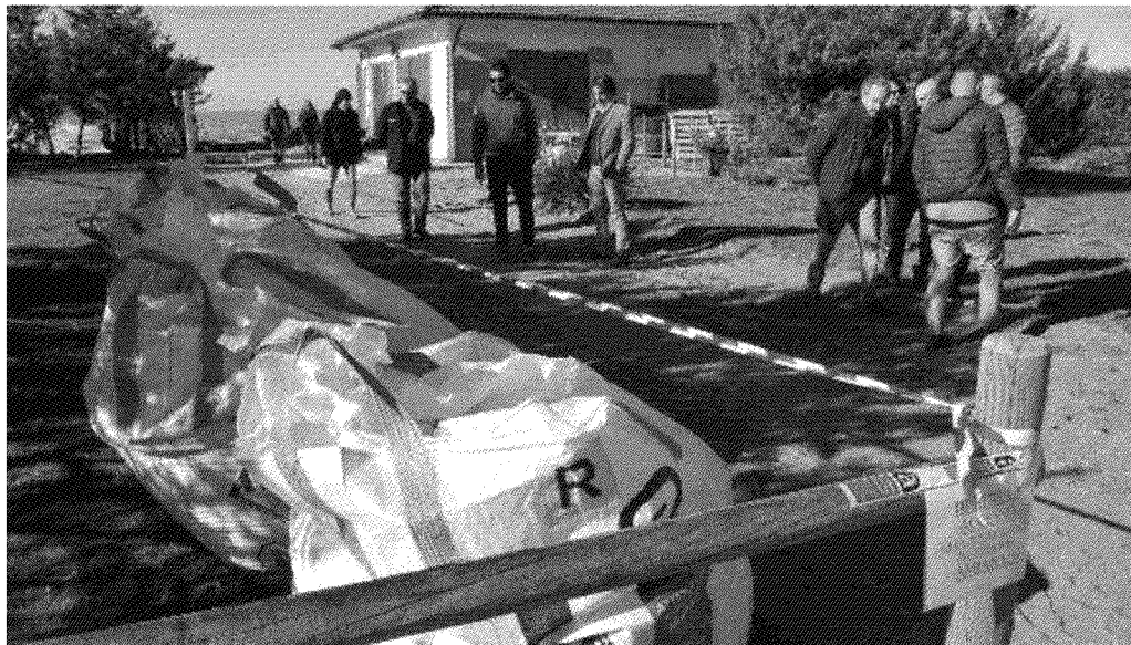
PERICOLO I quintali di amianto ritrovati sotto la sabbia al Bagno Irene. La nostra provincia è ad alto rischio

DOVEVA diventare un'area industriale e invece è una discarica abusiva. E i cittadini camminano in mezzo a rifiuti e amianto. Siamo a Pallerone di Aulla, nell'area della ex polveriera: capannoni pericolanti, marciapiedi mai completati, spazzatura abbandonata. E, come detto, anche amianto.