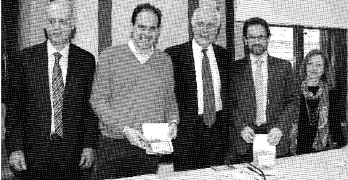
OCCASIONE DI CRESCITA Un momento della presentazione della nuova guida sulla Valle del Serchio