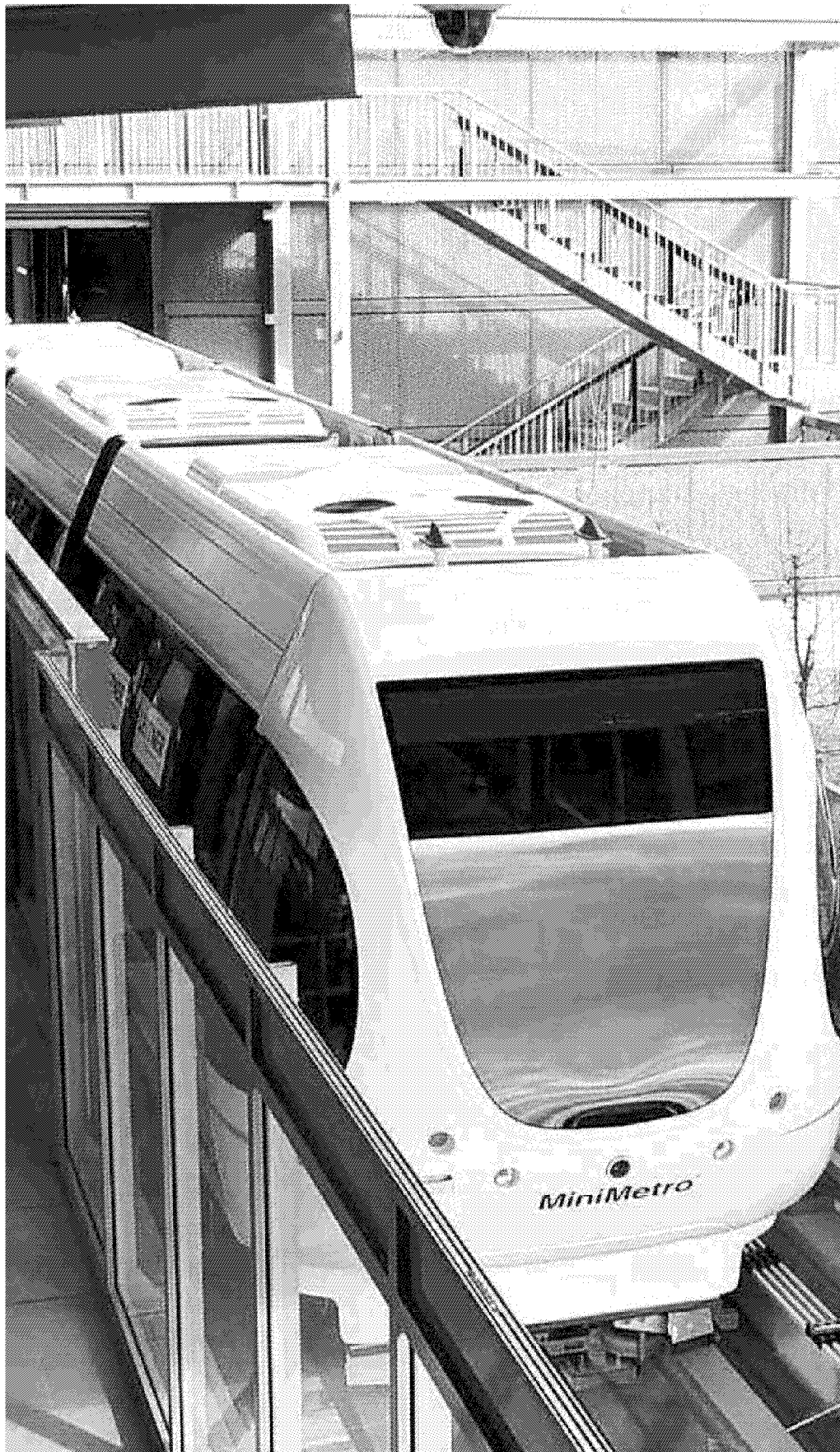
Uno dei treni del People Mover