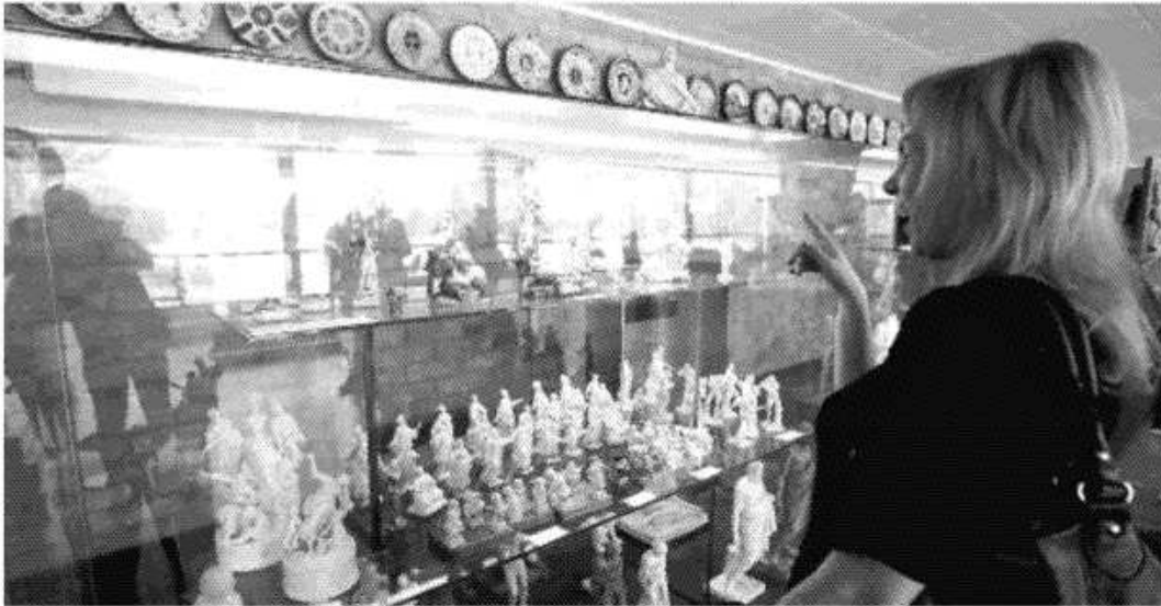
Straordinarie collezioni di ceramiche e porcellane nel museo di Doccia della Ginori

Ritaglio stampa ad uso esclusivo del destinatario, non riproducibile.