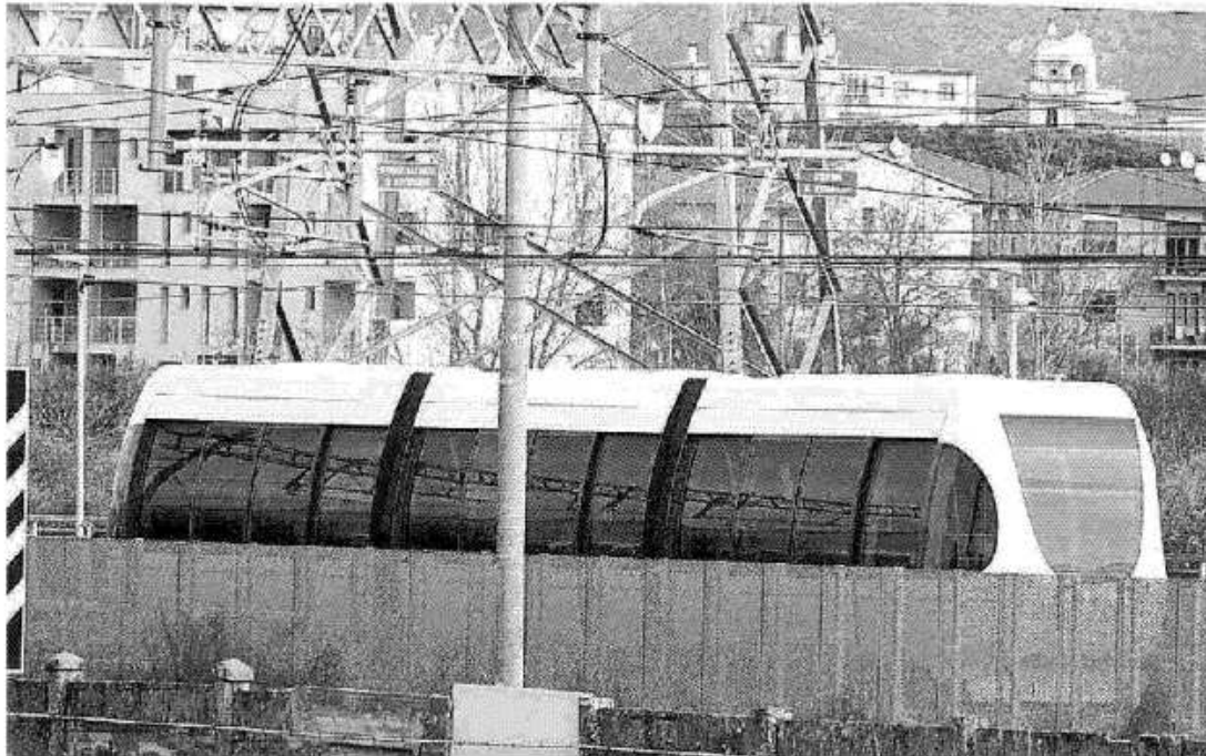
La navetta che sarà inaugurata oggi