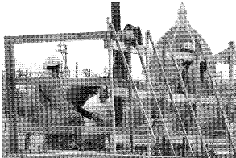
Un gruppo di operai al lavoro nel cantiere della Stazione Foster Contoro l'opera anche la comunità della parrocchia dell'Ascensione

SARÀ effettuata in orario notturno l'ultima fase dei getti sul viadotto San Donato, quella sul tratto sopra la rotatoria tra viale Forlanini e via di Novoli. Per consentire le operazioni, che saranno effettuate per due notti consecutive (dalle 21 di giovedì 16 alle 6 di venerdì 17 marzo e replica la sera successiva), sarà chiusa la corsia di collegamento tra viale Redi e via di Novoli in uscita città: i veicoli provenienti da viale Forlanini dovranno quindi svoltare a destra su via di Novoli. Inoltre dalle 2 alle 5 si aggiungerà anche la chiusura di via di Novoli nel tratto da via Forlanini a via Raghianti nella corsia in direzione uscita città. In questa fascia oraria i veicoli provenienti da viale Guidoni e diretti in via di Novoli utilizzeranno via Rastrelli-via Raghianti o via Pertini.