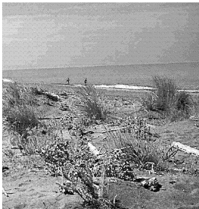
Un tratto di spiaggia a Marina di Bibbona

In queste settimane sta tornando il fratino, «un bellissimo uccellino, a rischio estinzione, e tali attività sono solo di disturbo e mettono a rischio i suoi siti di nidificazione – concludono –. Una duna, con tutto il suo ecosistema impiega anni per formarsi e stabilizzarsi e non è ammissibile che per il gusto di una falsa avventura venga spazzata via da comportamenti semplicemente incivili e di profonda ignoranza ambientale».