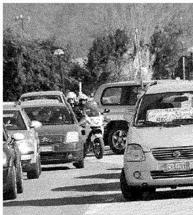
La manifestazione contro l'autostrada