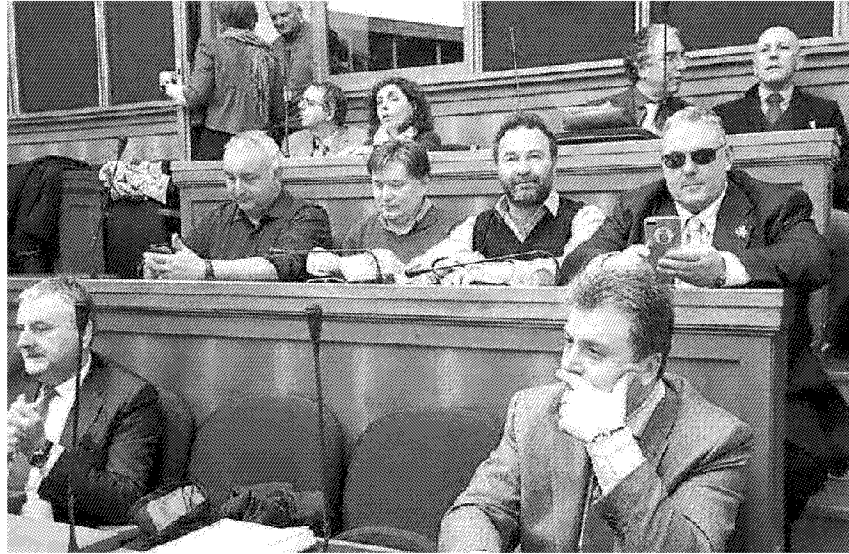
I sindaci a Roma alla Conferenza dei servizi