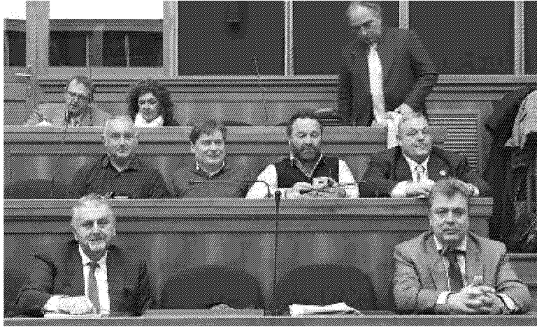
RIUNIONE Un momento della Conferenza dei servizi sul tracciato autostradale che si è svolta ieri mattina a Roma