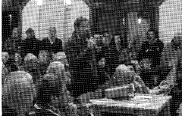
Cittadini all'assemblea per Scapigliato