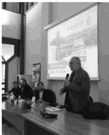
L'illustrazione del progetto Scapigliato