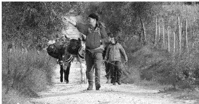
VISITATORI Il «turismo religioso» continua ad avere successo anche in vallata

va i pellegrini dal Mare del Nord a San Pietro) alla «Rotta degli Etruschi» (a cui partecipa anche Castiglion Fiorentino), passando per i «Cammini Francescani» (che dalla Verna coinvolgono e i «Cammini Lauretani» di cui Cortona è un Comune della provincia a farne parte). Proprio questi ultimi due, legati a stretto filo all'importante turismo religioso, hanno ricevuto dal Governo nuovi finanziamenti che potrebbero presto arrivare anche alla città etrusca. In pratica anche questi cammini, dopo numerose sollecitazioni, sono rientrate a pieno titolo nel fondo per lo sviluppo e la coesione 2014-2020 indetto dal Ministero dei beni e delle attività culturali e