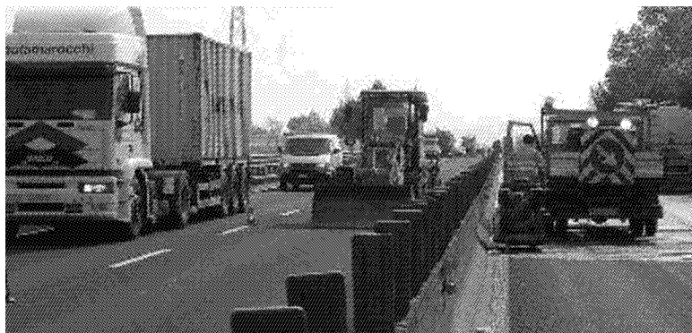
DISAGI Il miglioramento della Fi-Pi-Li è parte integrante del piano