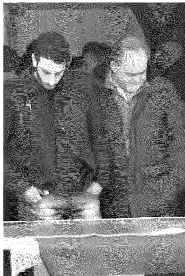
CITTADINI Il tracciato proposto da Sat lambisce le case

LA CONFERENZA dei servizi si è aperta lunedì al Ministero dei trasporti. Entro il 28 febbraio il percorso relativo al progetto di Sat dovrà essere concluso, e passare quindi al Cipe in caso di esito positivo. La Regione ha chiesto a Sat il piano finanziario dell'opera, per pronunciarsi in merito, ma secondo Sat questo potrà essere definito soltanto davanti al Cipe.