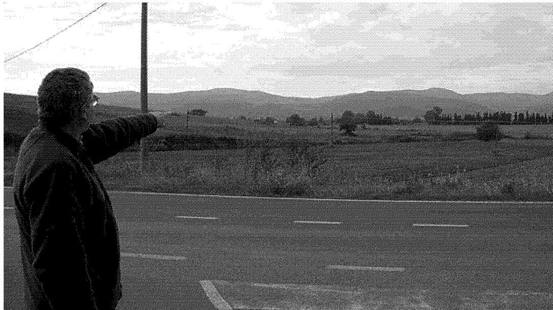
TERRITORIO Una delle zone che dovrebbero essere espropriate per costruire il corridoio tirrenico