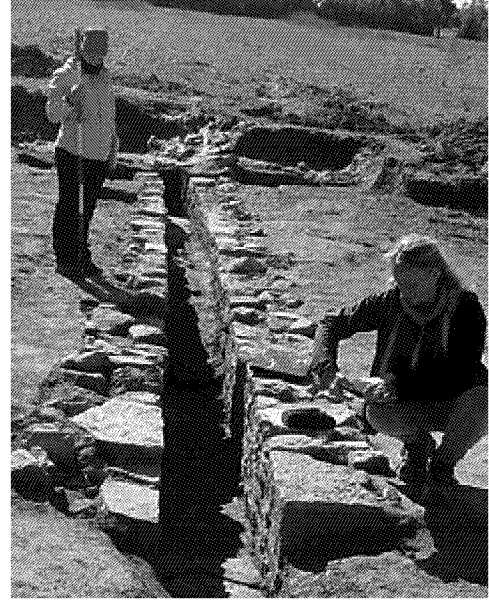
I REPERTI I ricercatori sul campo con le strutture per la canalizzazione delle acque riportate alla luce