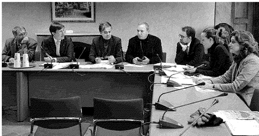
La riunione di giunta si è tenuta nella sede del Quartiere 2 a villa Arrivabene