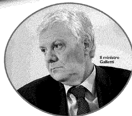
Il ministro Galletti