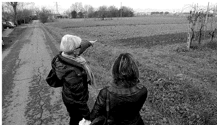
L'area dove sarà realizzato l'intervento, con la costruzione di cinquanta alloggi

Per quell'area il regolamento urbanistico fissa una destinazione d'uso residenziale per un totale di circa 4.000 metri quadri di superficie utile lorda; alla quota obbligatoria di 1.400 mq destinata all'affitto con vincolo a 25 anni, i proponenti aggiungono ulteriori quote a destinazione sociale. Così come previsto dalla legge ogni appartamento avrà un posto auto di pertinenza. Il primo lotto di opere a scemputo degli oneri di urbanizzazione per via della Pieve è stato approvato dalla giunta il 15 novembre, il giorno successivo l'amministrazione ha firmato la convenzione con il costruttore.