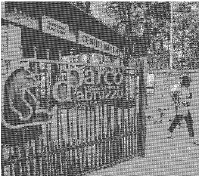
Sotto tutela Il 20% del territorio italiano