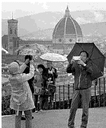
Turisti davanti al panorama dal piazzale Michelangelo

Segno "più" anche per movimenti e passeggeri dell'aeroporto di Firenze. Aumento dell'1,5% sui passeggeri internazionali (1,413 milioni) e del 2,4% sui movimenti internazionali