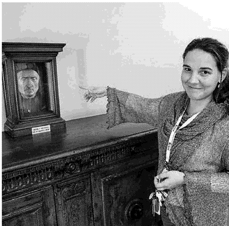
La maschera di Dante, una delle tappe del giro dedicato a Inferno dentro Palazzo Vecchio