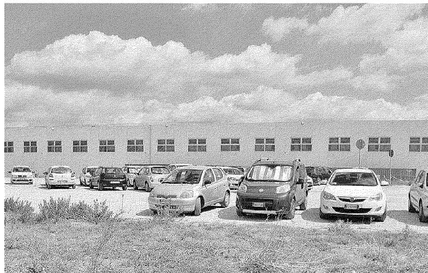
La sede della Computer gross in via Piovola (foto d'archivio)