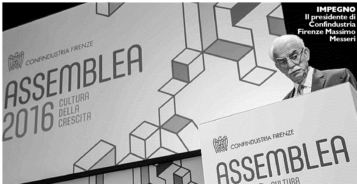
IMPEGNO Il presidente di Confindustria Firenze Massimo Messeri