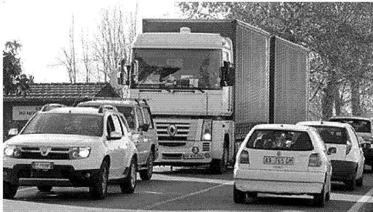
CAOS QUOTIDIANO A quando la realizzazione degli assi viari?

Per M5S e Sinistra hanno mentito sull'ok al progetto